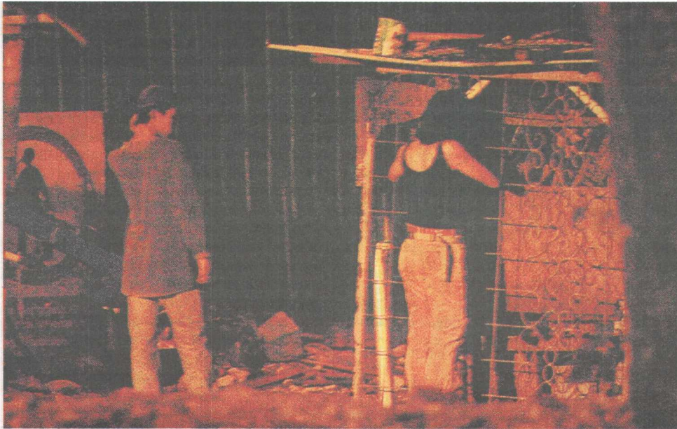
Terbiar dan hanyut dalam kehidupan, masih ada harapan untuk mereka kembali ke pangkal jalan.

Jabatan agama beri bantuan RM200000 setahun 28 Jun 2009 Berita Minggu