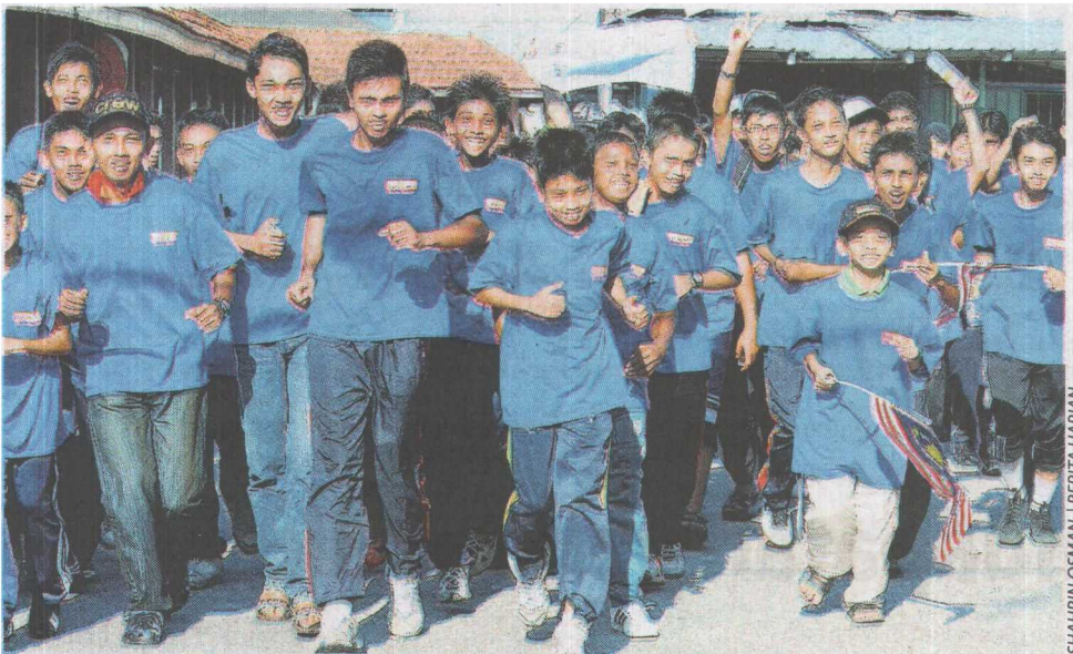
SAHABAT Kafe@Teen yang menyertai larian sempena hari terbuka Kafe@Teen di Butterworth.