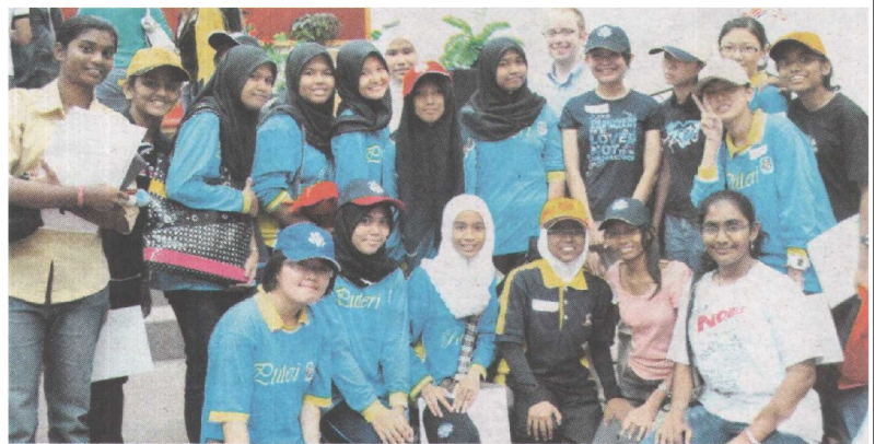
Pelajar SMK Convent bergambar selepas menyertai aktiviti kokurikulum.