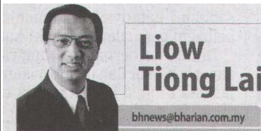
Liow Tiong Lai

Amal cara hidup sihat boleh elak penyakit membiak dalam badan