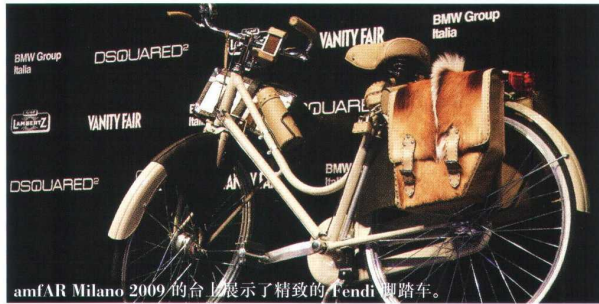
amfAR Milano 2009 的台上展示了精致的 Fendi 脚踏车。