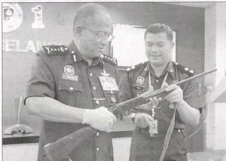
拿督苏克里（左）向媒体示范如何组装自制土枪。

拿督苏克里透露，警方于今早逮捕2名嫌犯时，起获一个黑色背包、一块白布、一把电锯、4枚空弹壳、6枚子弹、一把自制土枪及9架手机。不过，该只大壁虎至今仍下落不明。