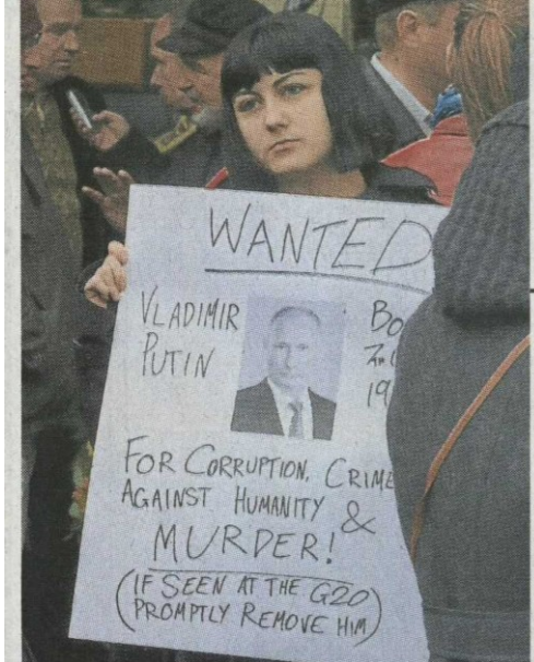
■参与悉尼示威的一名妇女，拿著一张声讨俄罗斯总统普汀的标语，要他对马航坠机负责。