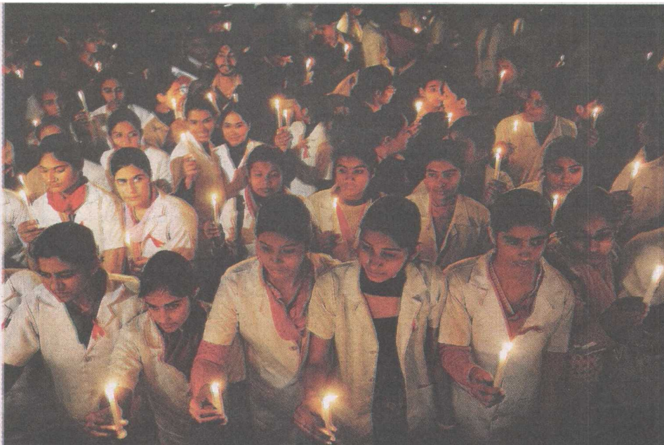
KESEDARAN...masyarakat dunia melakukan pelbagai aktiviti untuk memerangi HIV/Aids sempena Hari Aids Sedunia 1 Disember lalu.