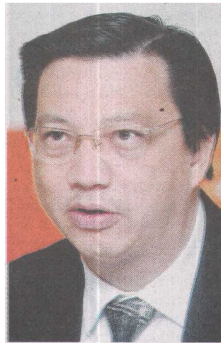
LIOW...punca utama jangkitan kerana berkongsi jarum

Language Malay Page No 20 Article Size 535 cm 2 Color Full Color ADValue 15,384 PRValue 46,152