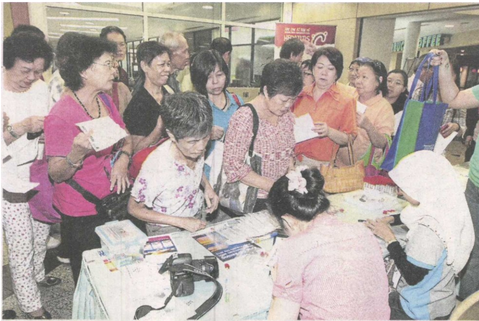
KESEDARAN... orang ramai menjalani ujian darah bagi mengesan hepatitis.