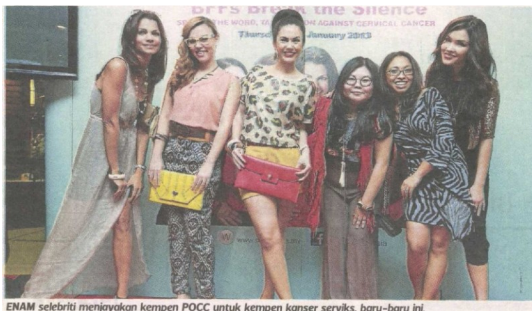
ENAM selebriti menjayakan kempen POCC untuk kempen kanser serviks, baru-baru ini.