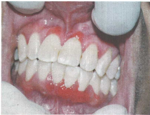
SERANGAN bakteria jenis patogen akan menyebabkan gusi bengkak dan kemerahan.