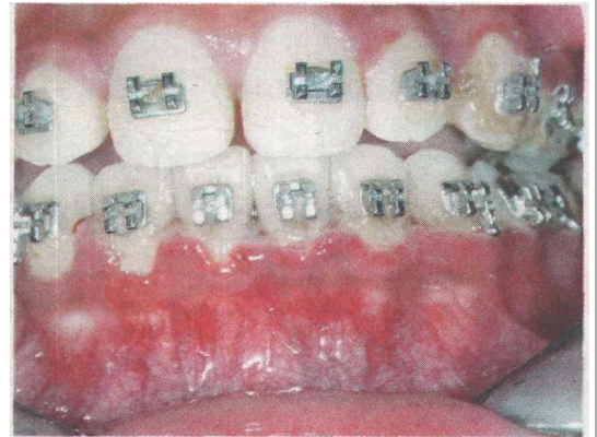
GUSI bertukar menjadi putih merupakan petanda kepada proses kematian sel akibat penyakit ANUG.