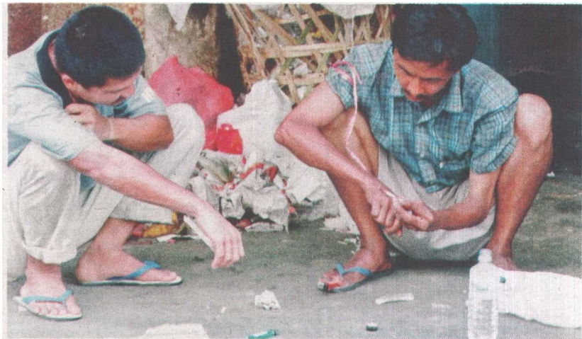
KINI penyalahgunaan dadah yang menjadi penyebab utama jangkitan HIV/AIDS dapat dikesan melalui keadaan gigi dan gusi seseorang. – Gambar Hiasan.

Language Malay Page No 48 Article Size 547 cm 2 Color Full Color ADValue 6,554 PRValue 19,661