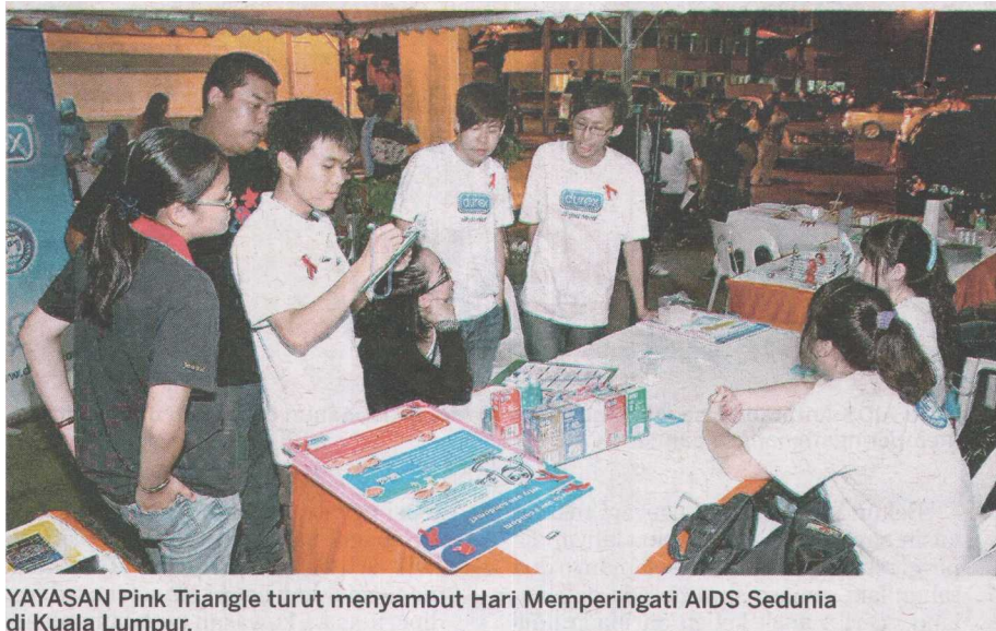
YAYASAN Pink Triangle turut menyambut Hari Memperingati AIDS Sedunia di Kuala Lumpur.

■ Pengasih Malaysia adalah sebuah badan tersendiri yang berpengalaman lebih daripada 20 tahun di dalam membantu dan memulih lelaki, wanita, tua, muda, dalam dan di luar negara melalui pendekatan Komuniti Terapeutik.