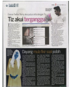
FIGURA yang dikenali dengan vokal yang mantap ini cukup bertuah kerana mempunyai ibu bapa yang cukup memahami senario terkini dirinya.