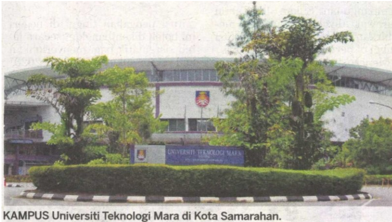
KAMPUS Universiti Teknologi Mara di Kota Samarahan.