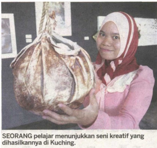
SEORANG pelajar menunjukkan seni kreatif yang dihasilkannya di Kuching.