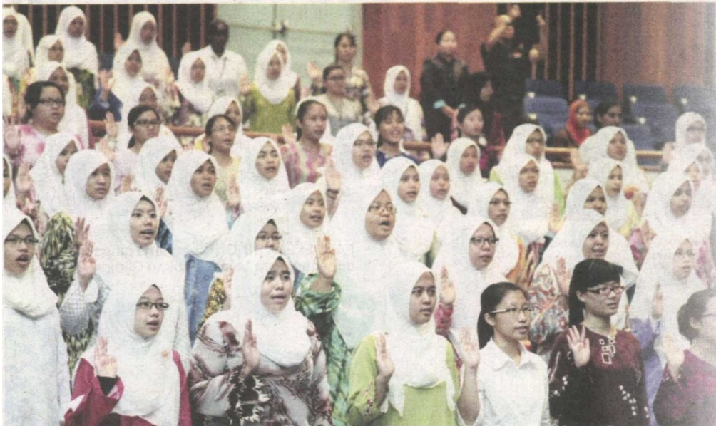
SEBAHAGIAN pelajar baharu institusi pengajian tinggi di Sarawak melafaz ikrar pada minggu suai kenal.