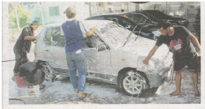
PENAGIH dadah yang mengikuti rawatan terapi gantian metadon boleh menjalani kehidupan yang produktif bersama masyarakat. – Gambar hiasan