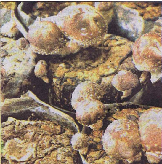
CENDAWAN SHIITAKE ... Inilah rupa cendawan Shiitake atau nama saintifiknya Lentinus Endodes yang ditanam di Masilou.