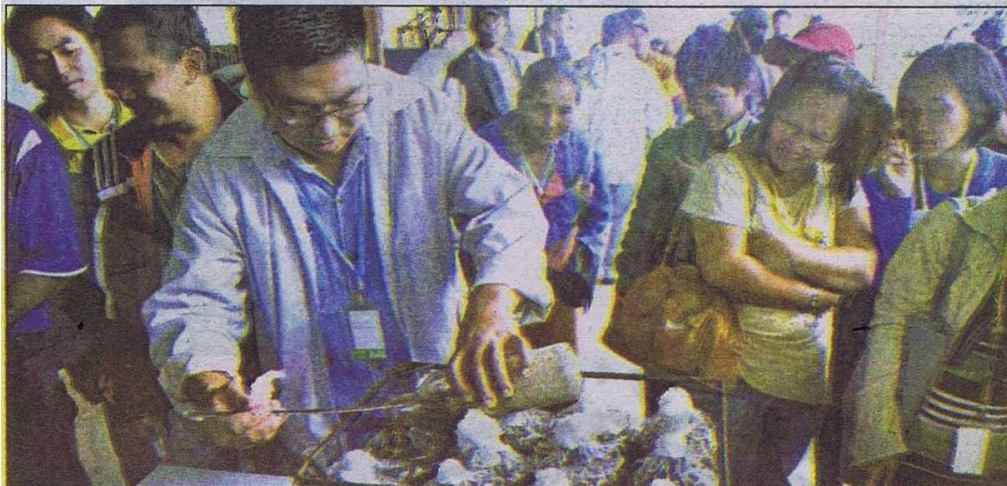
PRAKTIKAL ... Salah seorang peserta mencuba memasukkan bibit cendawan kedalam plastik.