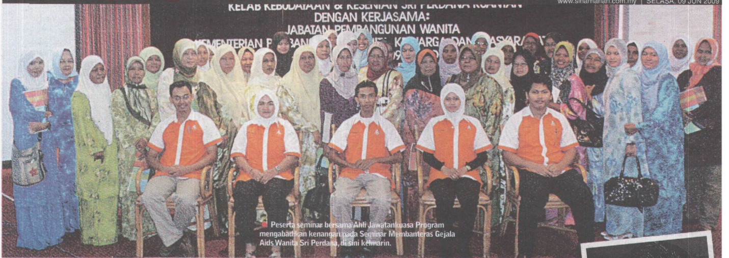
● Peserta seminar bersama Ahli Jawatankuasa Program mengabadikan kenangan pada Seminar Membanteras Gejala Aids Wanita Sri Perdana, di sini kelmarin.

www.sinarharian.com.my | SELASA, 09 JUN 2009