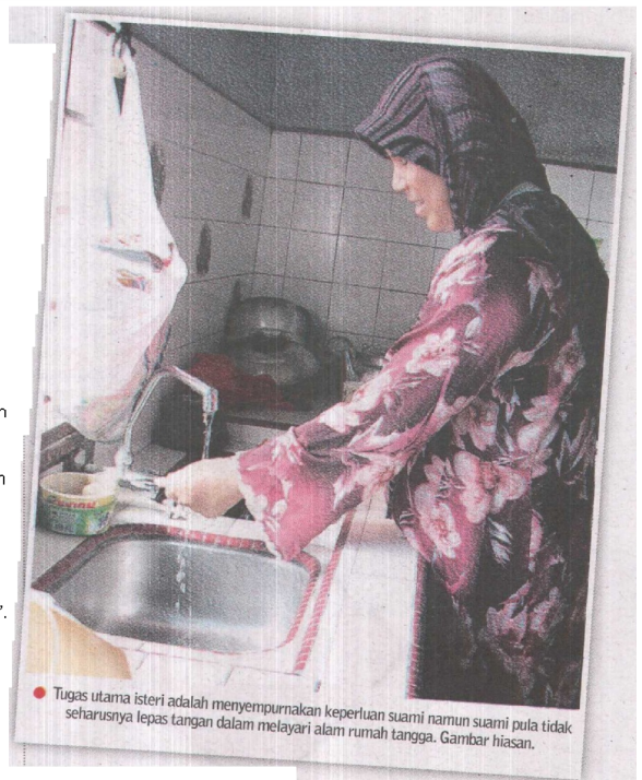
● Tugas utama isteri adalah menyempurnakan keperluan suami namun suami pula tidak seharusnya lepas tangan dalam melayari alam rumah tangga. Gambar hiasan.

Punca utama disebabkan tiada persepahaman antara mereka. Pada awal perkenalan, cinta menguasai segala-galanya. Namun, selepas berkahwin, barulah mereka kenal sikap sebenar pasangan. Bukan itu sahaja, faktor ekonomi juga mempengaruhi kehidupan berumah tangga. Sebelum berkahwin, pastikan pasangan mempunyai sumber ekonomi kukuh, tidaklah nanti wujud pertelingkahan sehingga menyebabkan penceraihan. Perkara ini perlu dipandang serius setiap pasangan. Berkahwin memanglah sangat dinanti-nantikan, namun untuk melaksanakan tanggungjawab sebagai suami atau isteri memerlukan persediaan fizikal dan mental. Berusaha untuk memperbaiki kelemahan diri dan terapkan elemen hormat-menghormati sesama pasangan. Melakukan kesalahan adalah normal dalam hubungan