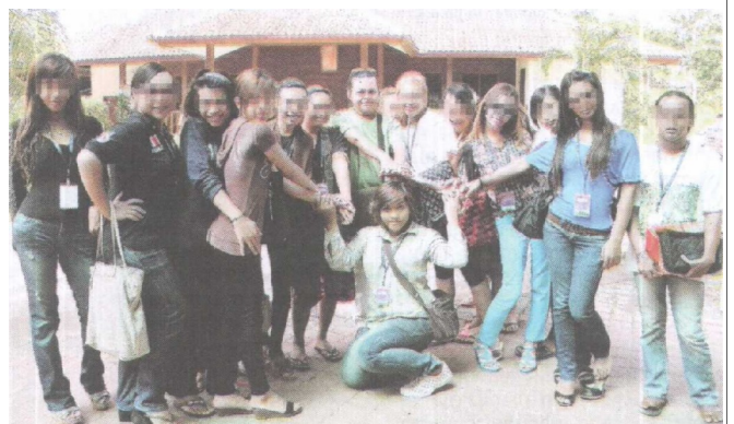
Para peserta Program Mukhayyam Bersama Golongan Mak Nyah Siri II di Kuantan, Pahang.