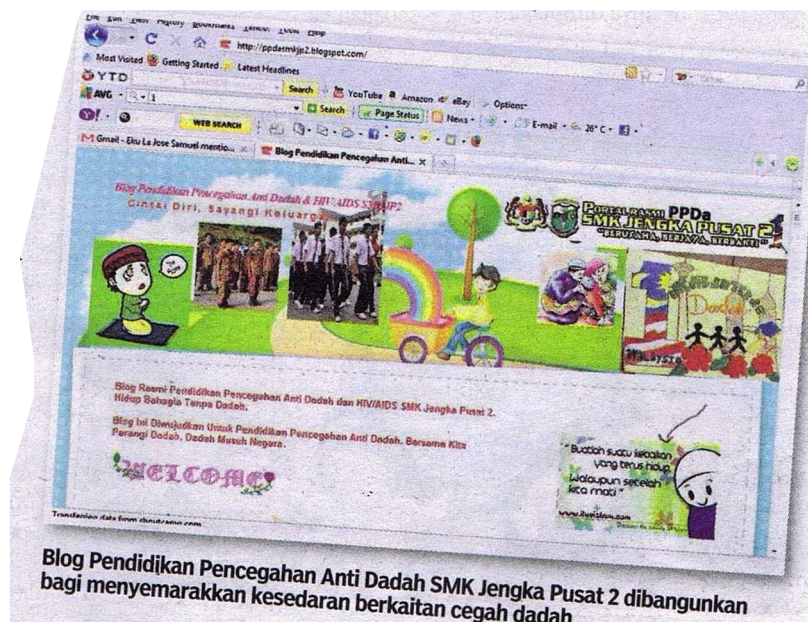
Blog Pendidikan Pencegahan Anti Dadah SMK Jengka Pusat 2 dibangunkan bagi menyemarakkan kesedaran berkaitan cegah dadah.

Blog yang saya wujudkan adalah berasaskan 'free hosting' seperti 'blogspot' mahupun blog berbayar seperti 'wordpress' 'selfhosting' dan kedua-dua blog dibangunkan bagi menyediakan dan mengumpulkan maklumat hanya di hujung jari.