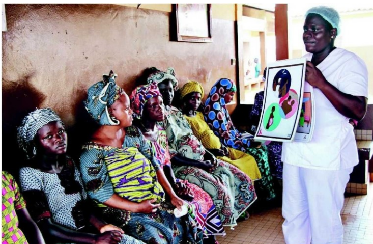
Seorang bidan memberikan maklumat tentang Aids kepada wanita hamil di Bohicon, selatan Benin.

Aids: Acquired Immunodeficiency Syndrome atau Sindrom Kurang Daya Tahan adalah sejenis penyakit serius yang disebabkan oleh virus HIV.